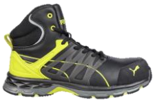
VELOCITY 2.0 YELLOW MID 633880