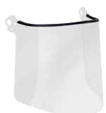
WVI00024 PLASMA FACE SHIELD